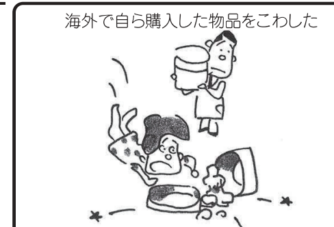
ショッピングガード